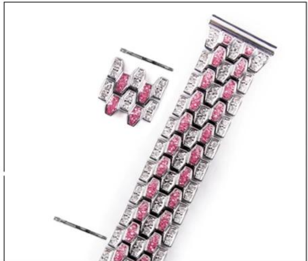
04: Add links on- Align the needle end of the pin to small hole in the band according the arrow direction showing in picture, rotating the wheel to push the pinhead in completely.