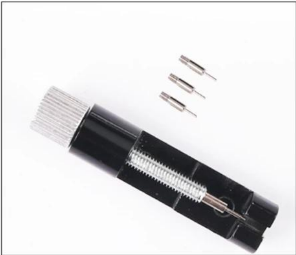
01: Comes with a tool kit to adjust the band easily.