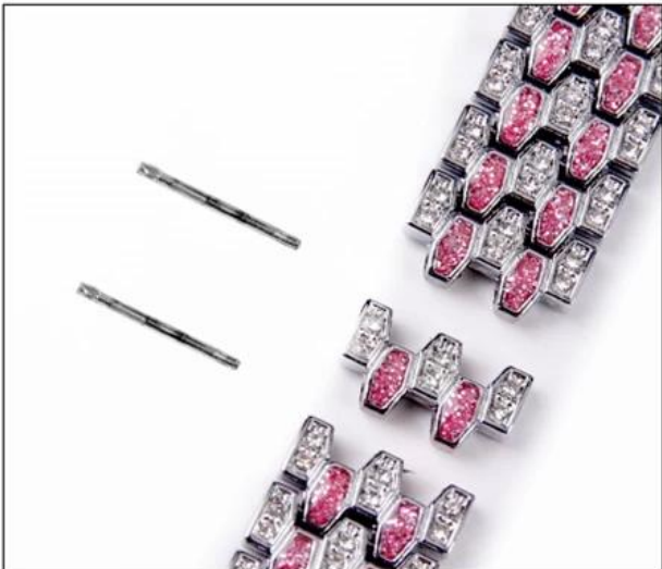
03: Pull the pin out with your hand when the needle head comes out.