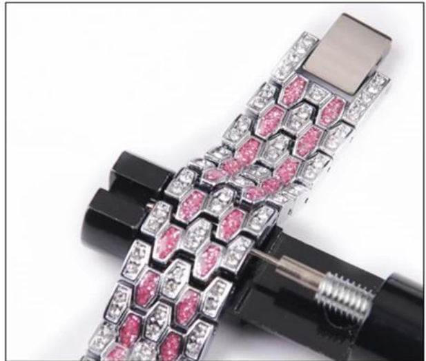
02: Remove extra links- Align the pin inside the band to tool needle according the arrow direction showing in picture,rotate the tool wheel to push the pin out.