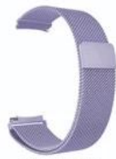
8#薰衣草紫 Lavender Purple