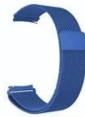
10#深蓝色 Navy blue