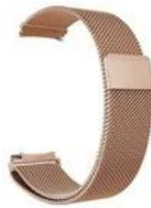
3#玫瑰金 Rose gold