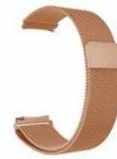
9#香槟金 Champagne Gold