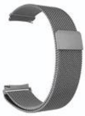
6#太空灰 Space gray