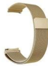
4#土豪金 Tyrant Gold