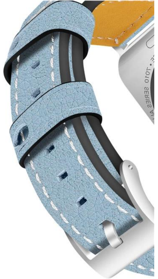
Exquisite side line