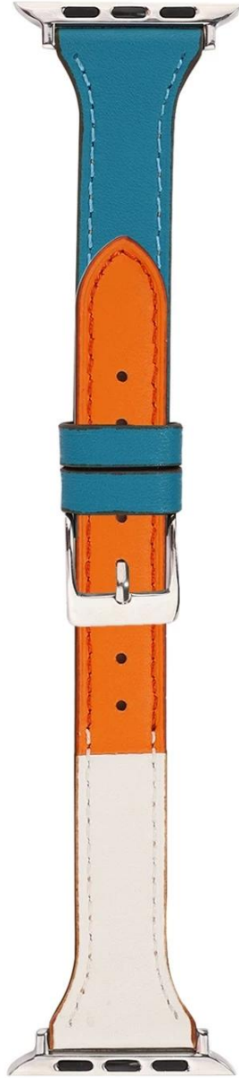
#3 深蓝+白/Deep blue+white