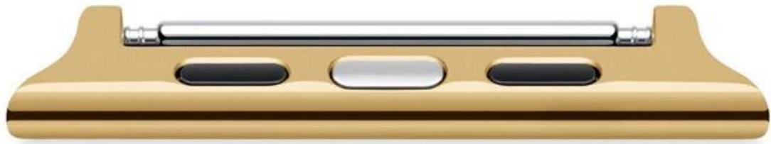
38mm Apple Watch Adapter