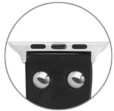
Studded Leather Band