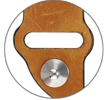
It Tucks Inside and No Bulky