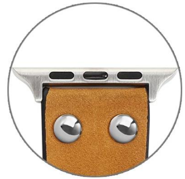
Studded Leather Band