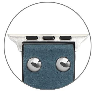
Studded Leather Band