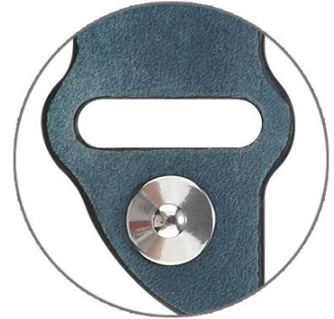
It Tucks Inside and No Bulky