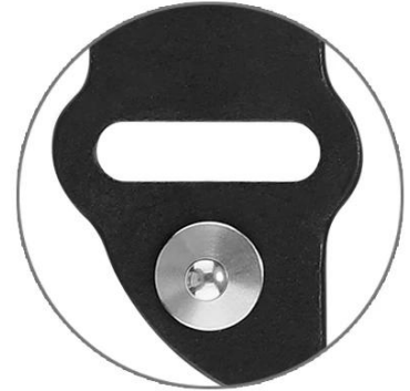
It Tucks Inside and No Bulky