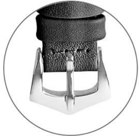
Stainless steel buckle