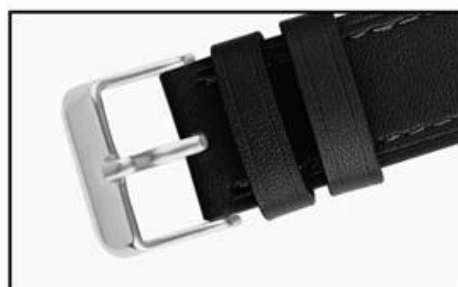
Stainless steel buckle