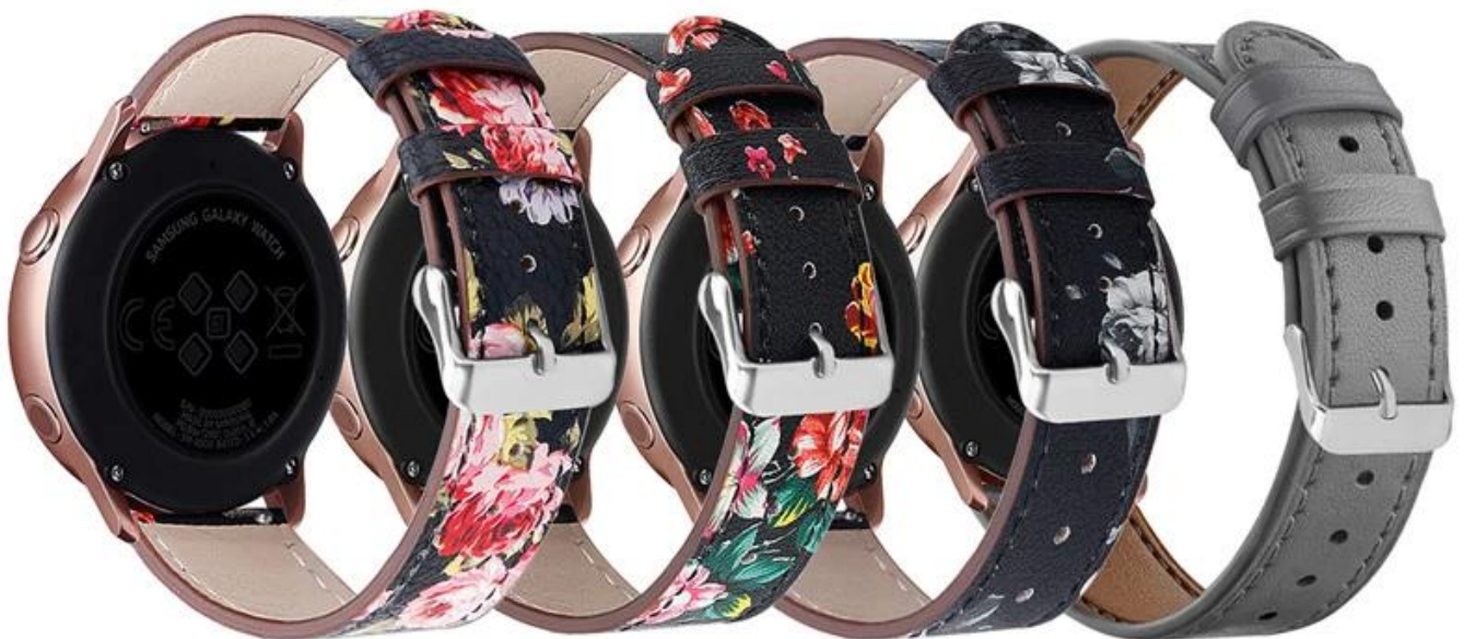
粉花 红花 灰花 灰色