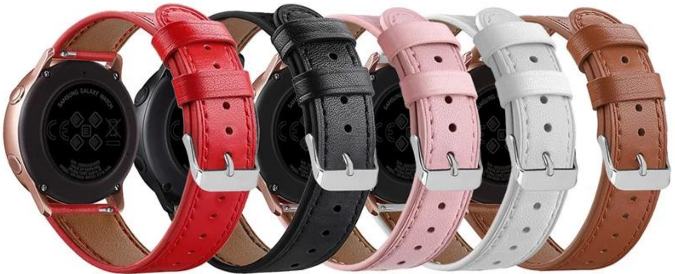
红色 黑色 粉色 白色 棕色