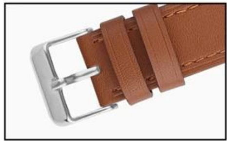
Stainless steel buckle