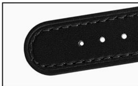
Round leather tail