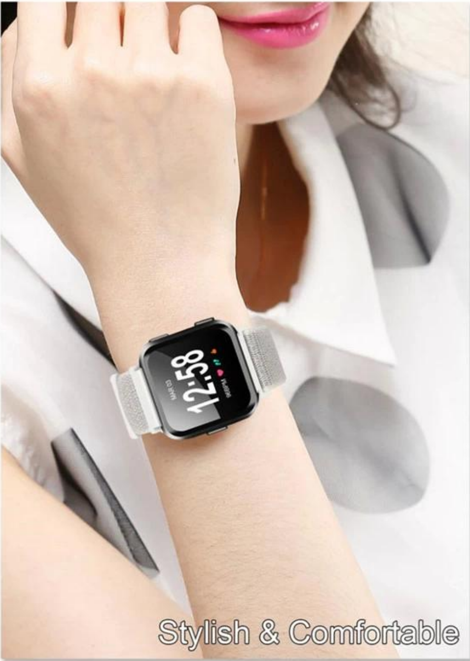
Stylish & Comfortable