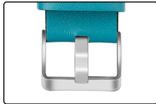
Stainless Steel Buckle