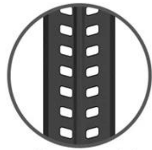
Double-row meter holes