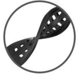
TPU soft band