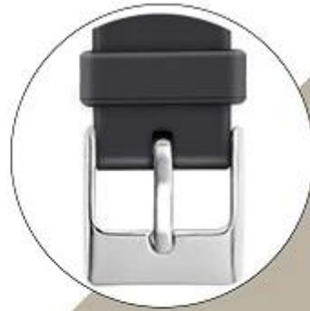
Polished Stainless Steel Buckle Great match for any color plated watch