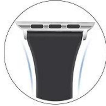
Metal particle Streamline desian