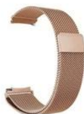
3#玫瑰金 Rose gold