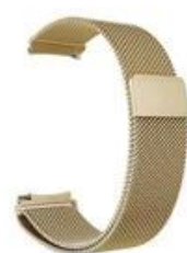
4#土豪金 Tyrant Gold