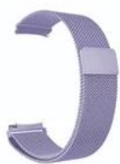
8#薰衣草紫 Lavender Purple