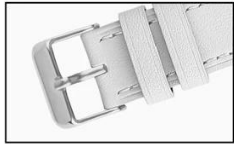
Stainless steel buckle