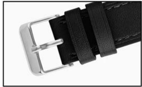
Stainless steel buckle