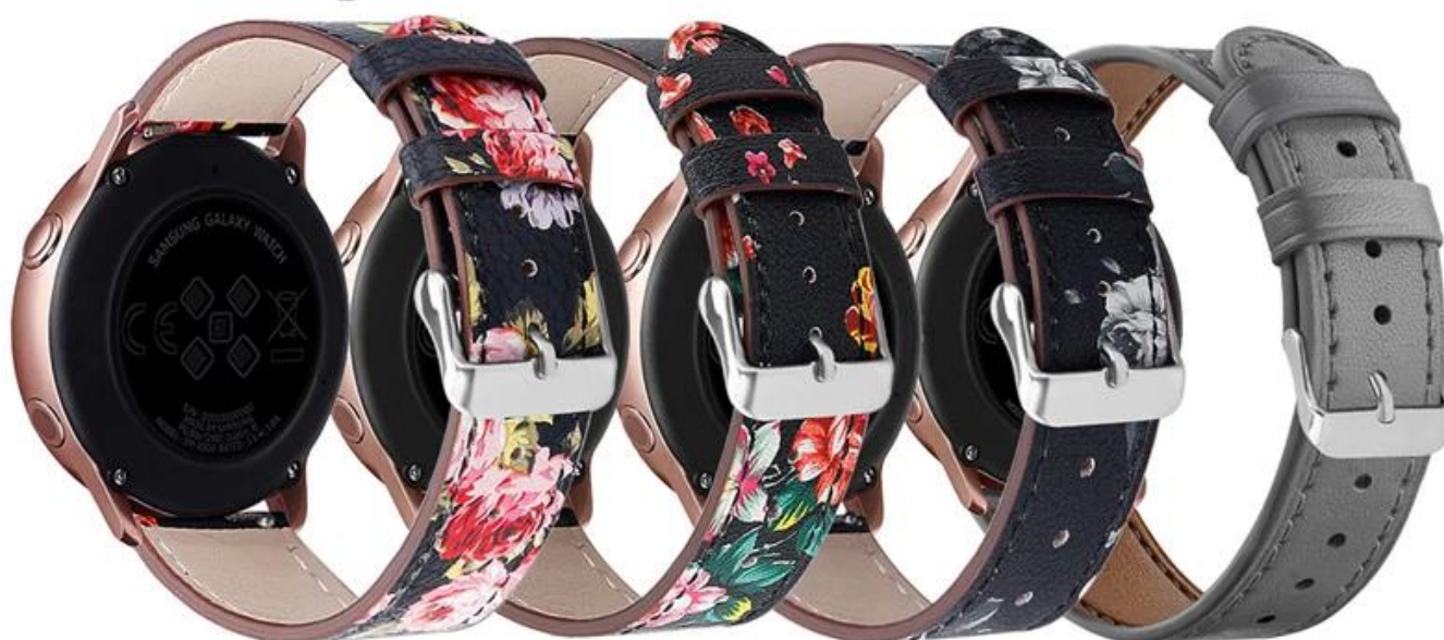
粉花 红花 灰花 灰色