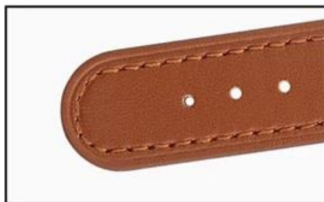
Round leather tail