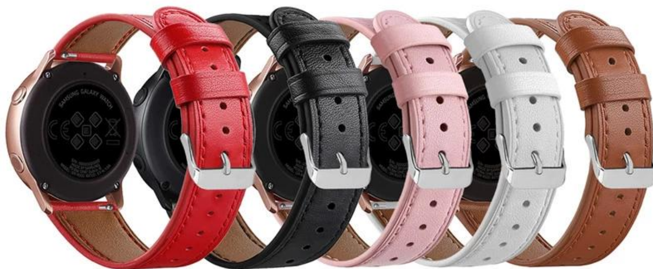
红色 黑色 粉色 白色 棕色