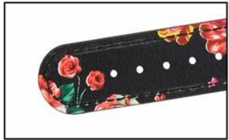
Round leather tail