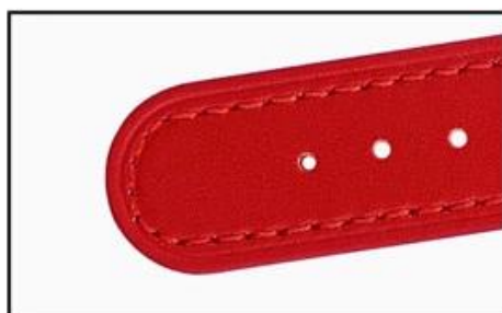
Round leather tail