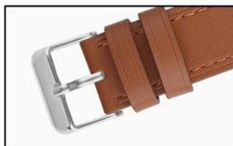
Stainless steel buckle