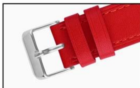
Stainless steel buckle