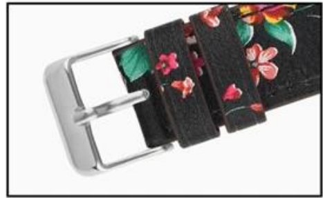
Stainless steel buckle