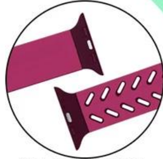
One-piece molding process