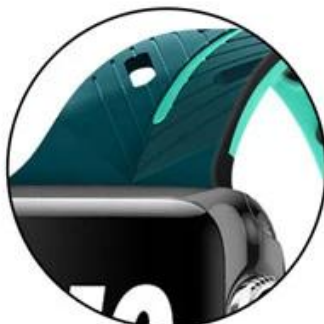
Card-bit precision seamless fit