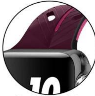
Card-bit precision seamless fit