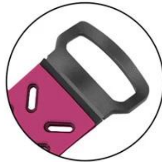
Stainless steel pin