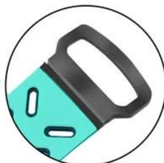
Stainless steel pin