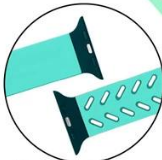
One-piece molding process