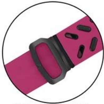
Easy to clasp the pin-tuck lock