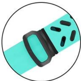
Easy to clasp the pin-tuck lock