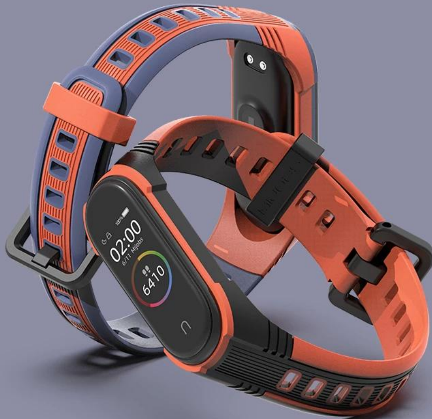
Heat Orange-Midnight Blue