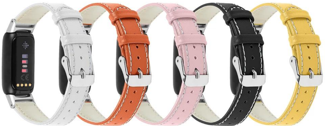
6.白色 7.橙色 8.粉色 9.黑色 10.黄色