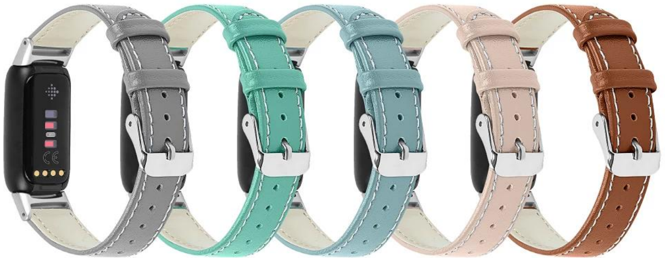
1.奶奶灰 2.水鸭绿 3.雾霾蓝 4.杏色 5.棕色