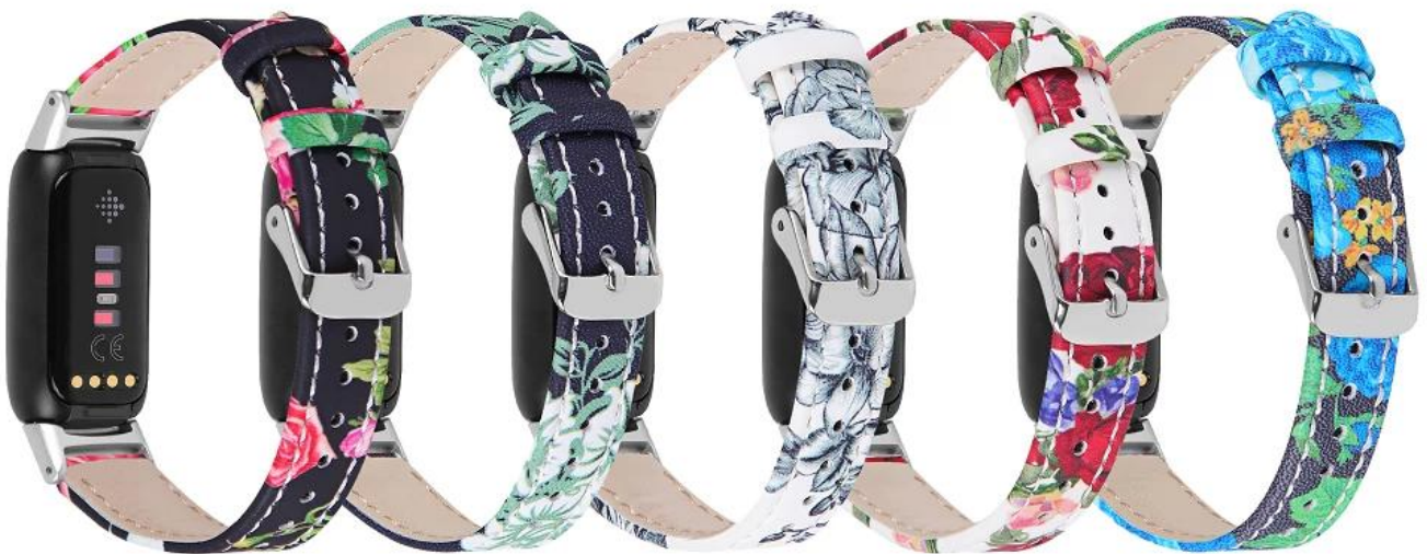
11.A 12.B 13.E 14.H 15.J