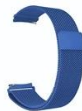
10#深蓝色 Navy blue