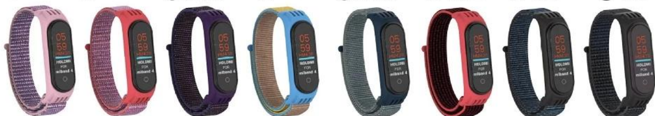
⑰ 粉砂 ⑱ 杏桃 ⑲ 靛蓝 ⑳ 驼色 ㉑ 风云灰 ㉒ 红黑条 ㉓ 灰黑 ㉔ 黑白条