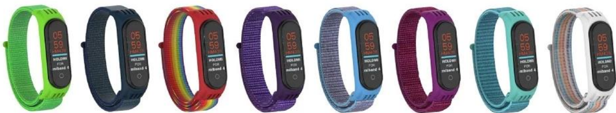
① 薄荷绿 ② 深雾灰 ③ 渐变色彩虹 ④ 薰衣草 ⑤ 蔚蓝 ⑥ 火龙果 ⑦ 菊蓝 ⑧ 彩虹条