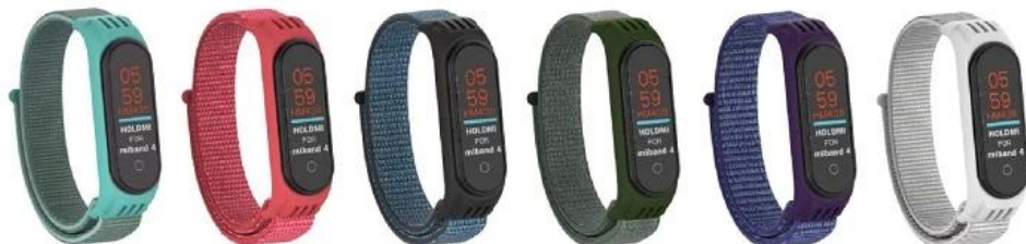
㉕ 碧海 ㉖ 木槿粉 ㉗ 葡萄紫 ㉘ 深橄榄 ㉙ 午夜蓝 ㉚ 海贝