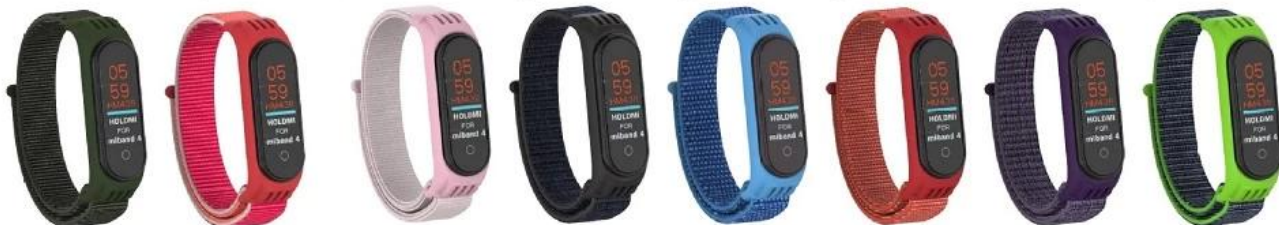
⑨ 军绿 ⑩ 石榴 ⑪ 珍珠粉 ⑫ 黑砂 ⑬ 海角蓝 ⑭ 玫瑰红 ⑮ 烟紫 ⑯ 亮黄