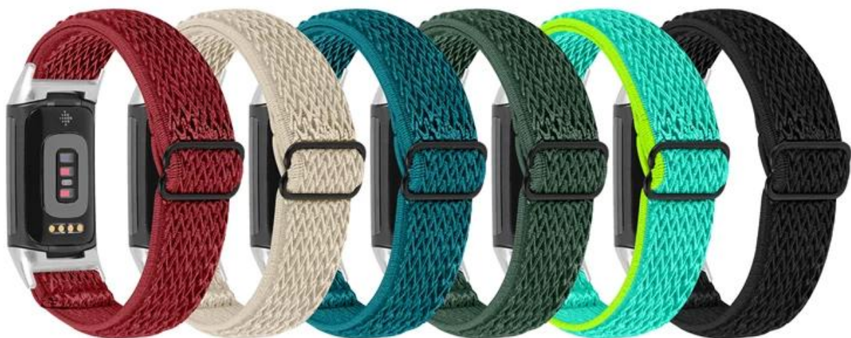
1#中国红 2#杏色 3#石青 4#军绿 5#黄绿 6#黑色