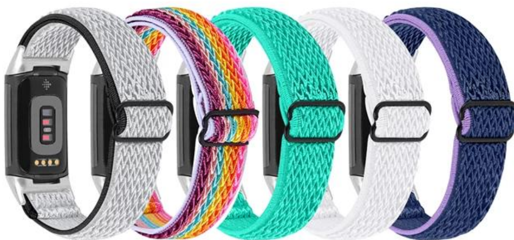
7#黑白 8#彩虹 9#薄荷绿 10#白色 11#紫蓝