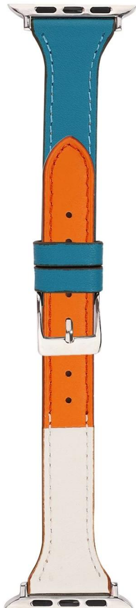
#2 天蓝+白/Sky blue+white