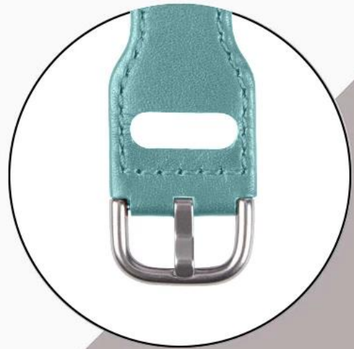
Classic Stainless Steel Buckle