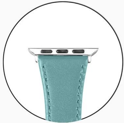
Unique & Breathable Design