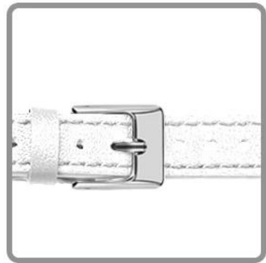
Genuine leather strap