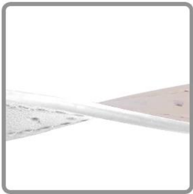
Strap is soft