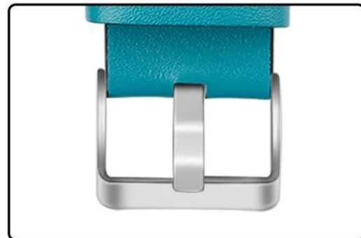
Stainless Steel Buckle