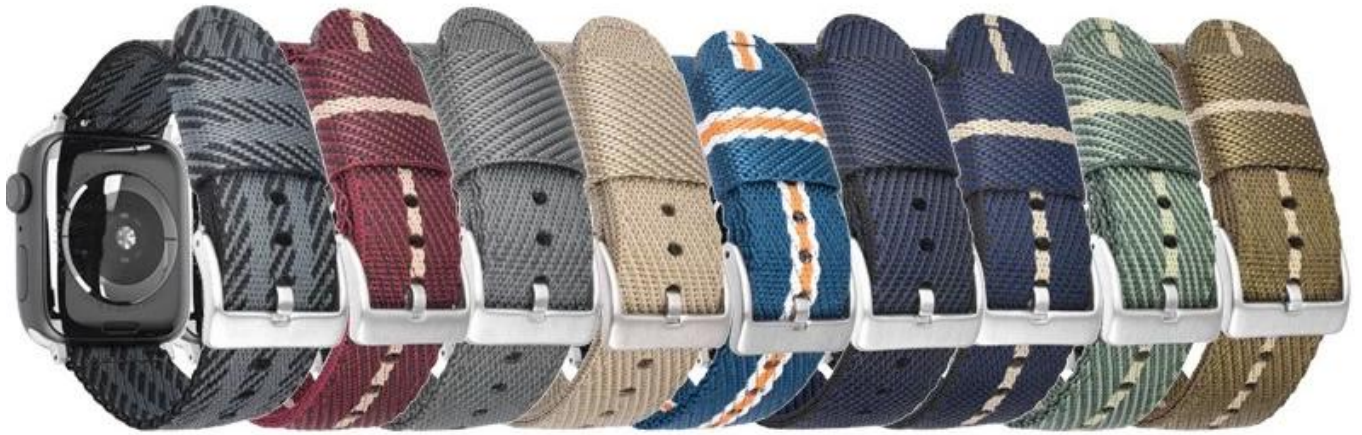
S#1 S#2 S#3 S#4 S#5 S#6 S#7 S#8 S#9