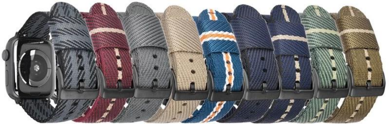
B#1 B#2 B#3 B#4 B#5 B#6 B#7 B#8 B#9