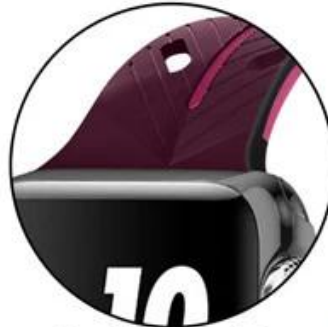
Card-bit precision seamless fit