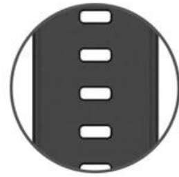
Single row surface hole