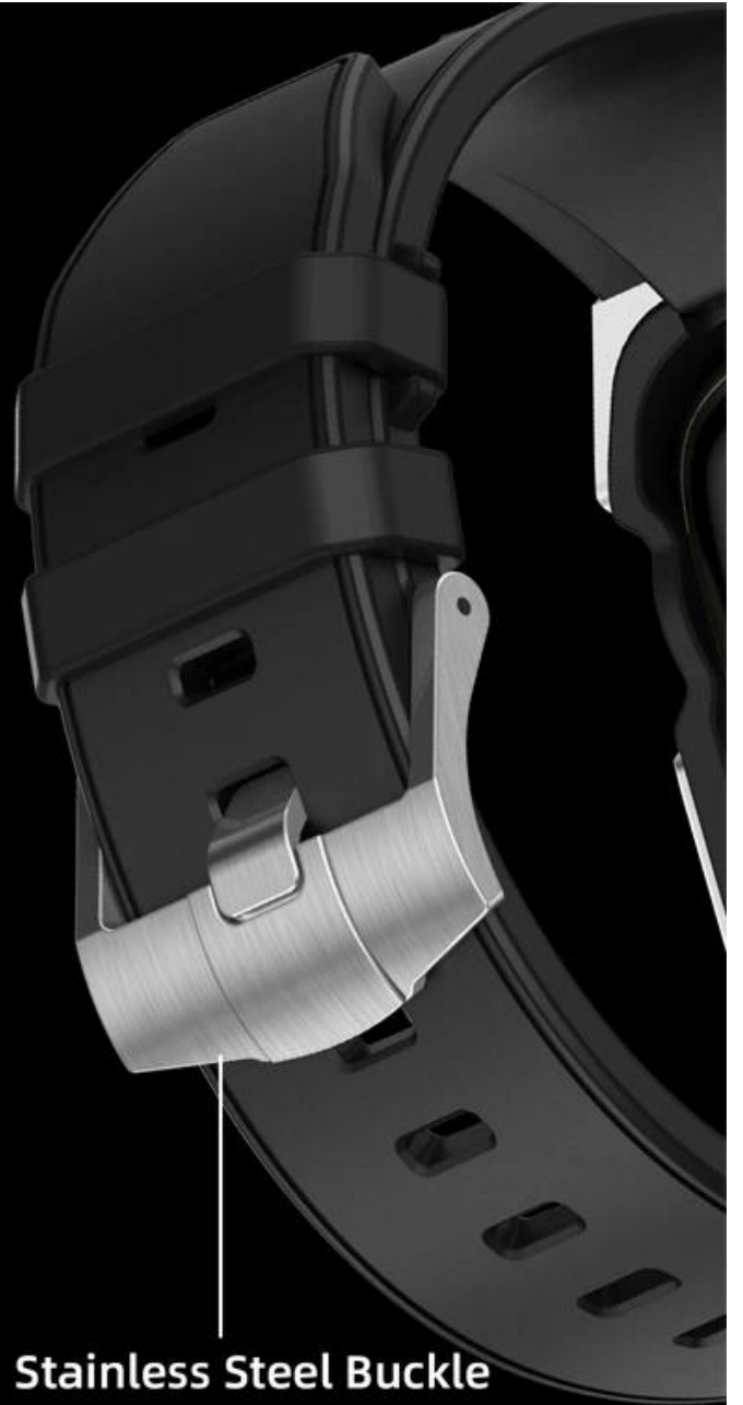
Stainless Steel Buckle