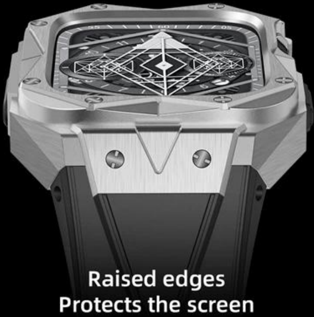
Raised edges Protects the screen