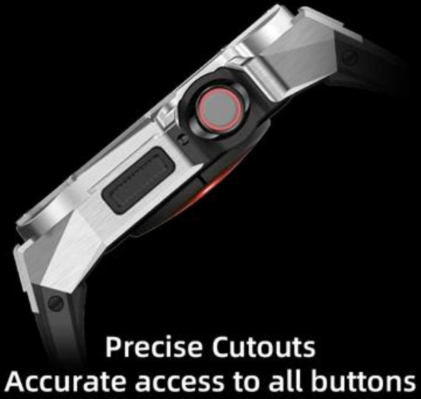
Precise Cutouts Accurate access to all buttons