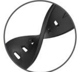
TPU soft band