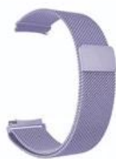
8#薰衣草紫 Lavender Purple