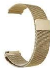
4#土豪金 Tyrant Gold