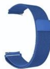
10#深蓝色 Navy blue