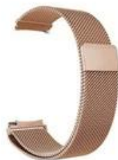
3#玫瑰金 Rose gold