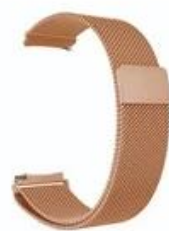
9#香槟金 Champagne Gold