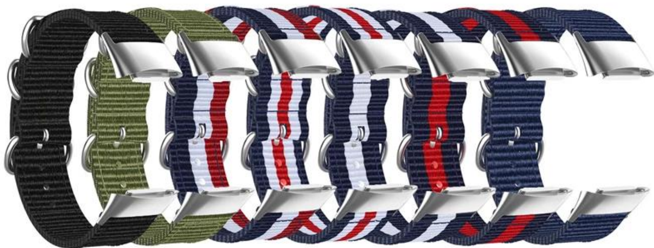
黑色 军绿 蓝白红 蓝白红白红 蓝白蓝 蓝红蓝 深蓝