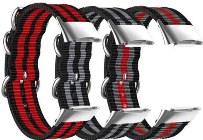
黑红黑红黑 黑灰黑灰黑 黑灰红灰黑