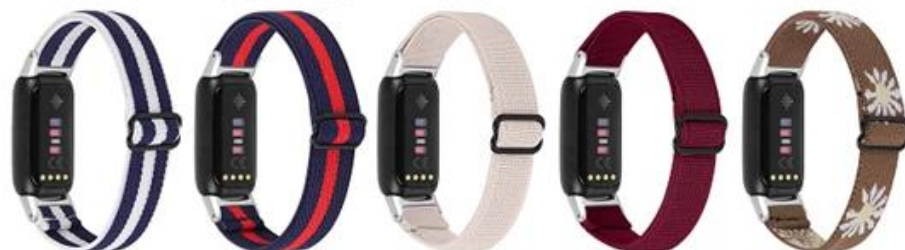
22.午夜蓝间白 23.午夜蓝间红 24.杏色 25.中国红 26.棕雏菊