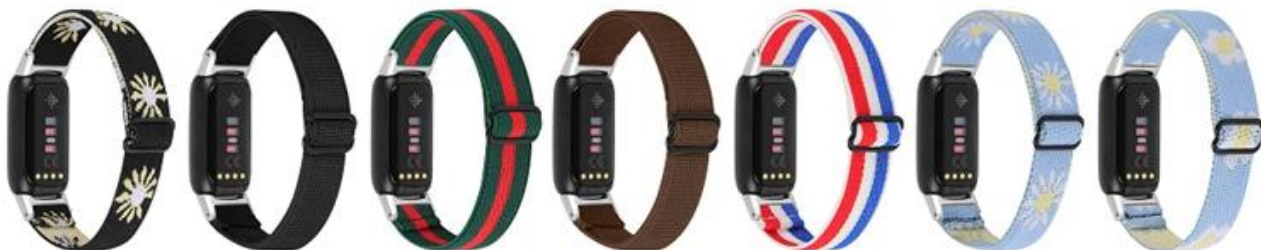
8.黑雏菊 9.黑色 10.军绿间红 11.咖啡 12.蓝白红 13.蓝雏菊 14.蓝太阳花