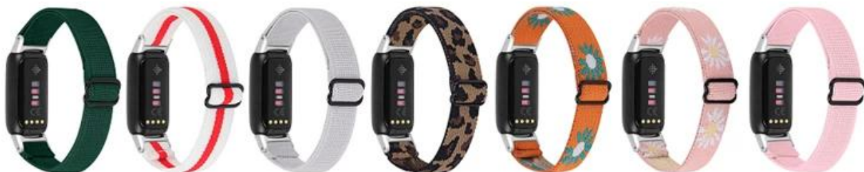
1.暗绿 2.白间红 3.白色 4.豹纹 5.橙雏菊 6.粉雏菊 7.粉色