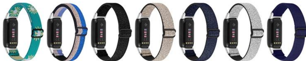
15.绿雏菊 16.闪光蓝配银 17.闪黑 18.闪金 19.闪蓝 20.闪银 21.深蓝